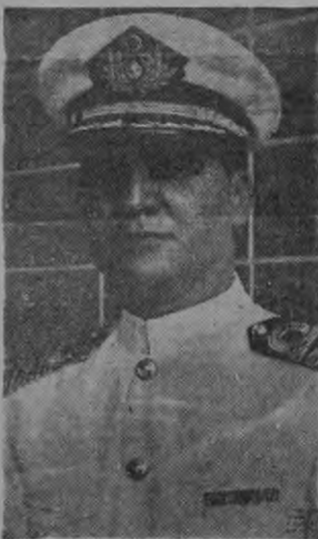
Almirante LARRAZABAL ...comienza su campaña...

CARACAS, 11 (AP)—El Almirante Wolfgang Larrazabal es esperado el sábado aparentemente para iniciar su campaña presidencial. Ha estado como Embajador en Chile desde que perdió las elecciones presidenciales de 1958.