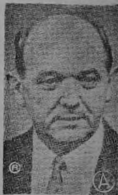
DEAN RUSK ...fue interpelado por el Congreso...