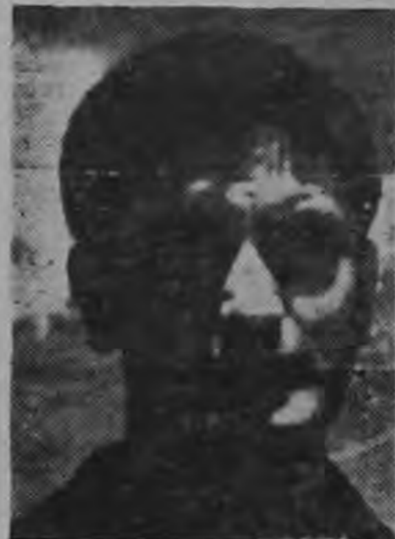
Exactamente de hoy en ocho días estará entrando en la vida seria de hogar el popular futbolista internacional Hernán (Cuty) Monge.